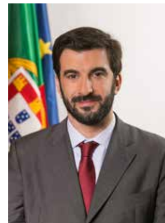
Tiago Brandão Rodrigues Ministro da Educação