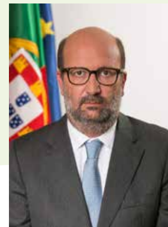
João Pedro Matos Fernandes Ministro do Ambiente