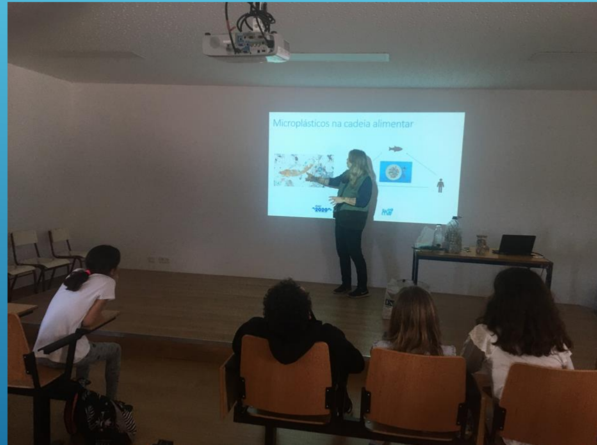
Sessão teórica com alunos de 6º ano na escola Prof. António Bento Franco, na Ericeira