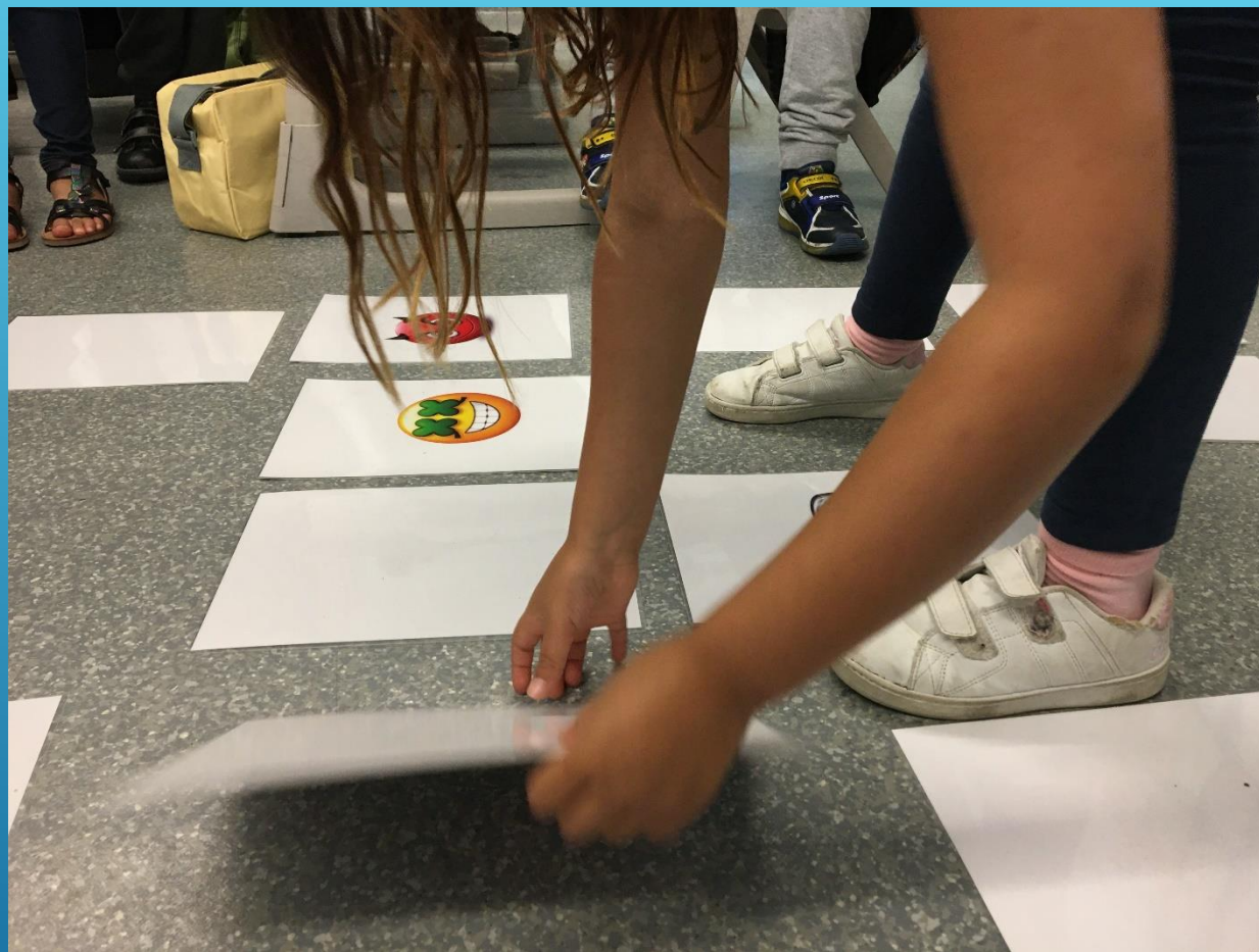
Jogos e atividades exploratórias com alunos da EB da Ericeira