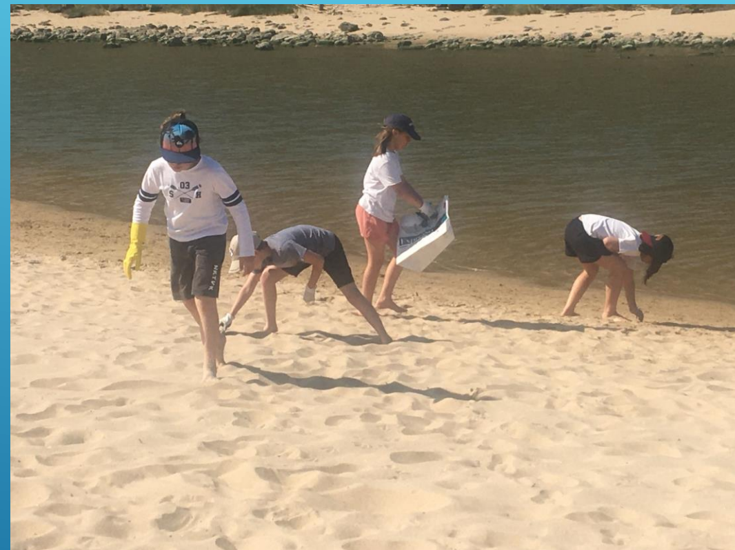
Limpeza de Praia na Foz do Lizandro com alunos da Escola Básica da Ericeira