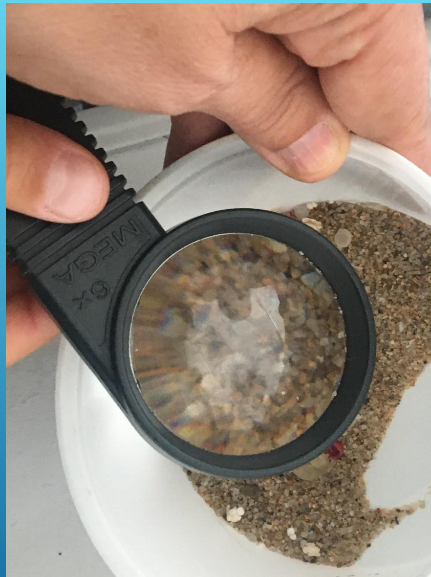
Observação de microplásticos com alunos da EB da Ericeira