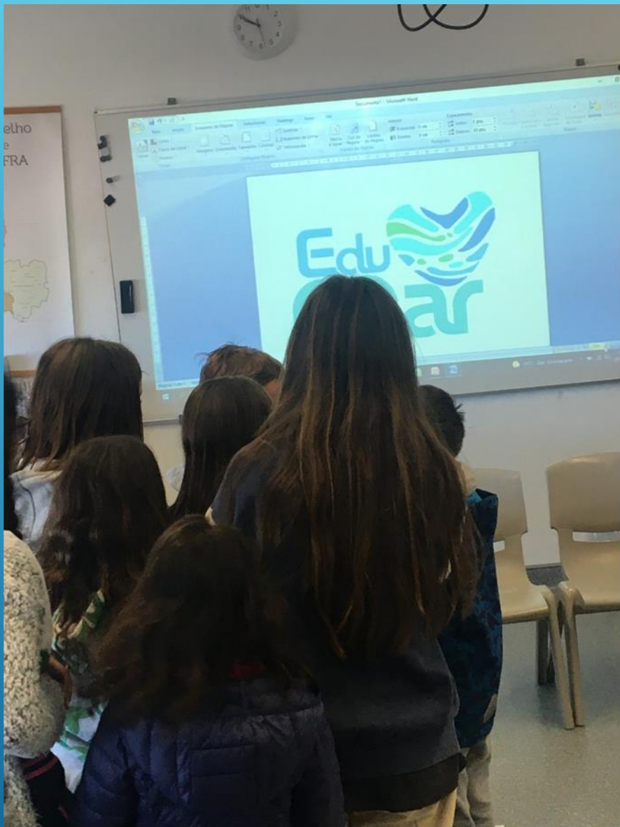
Sessão teórica na Escola Básica da Ericeira