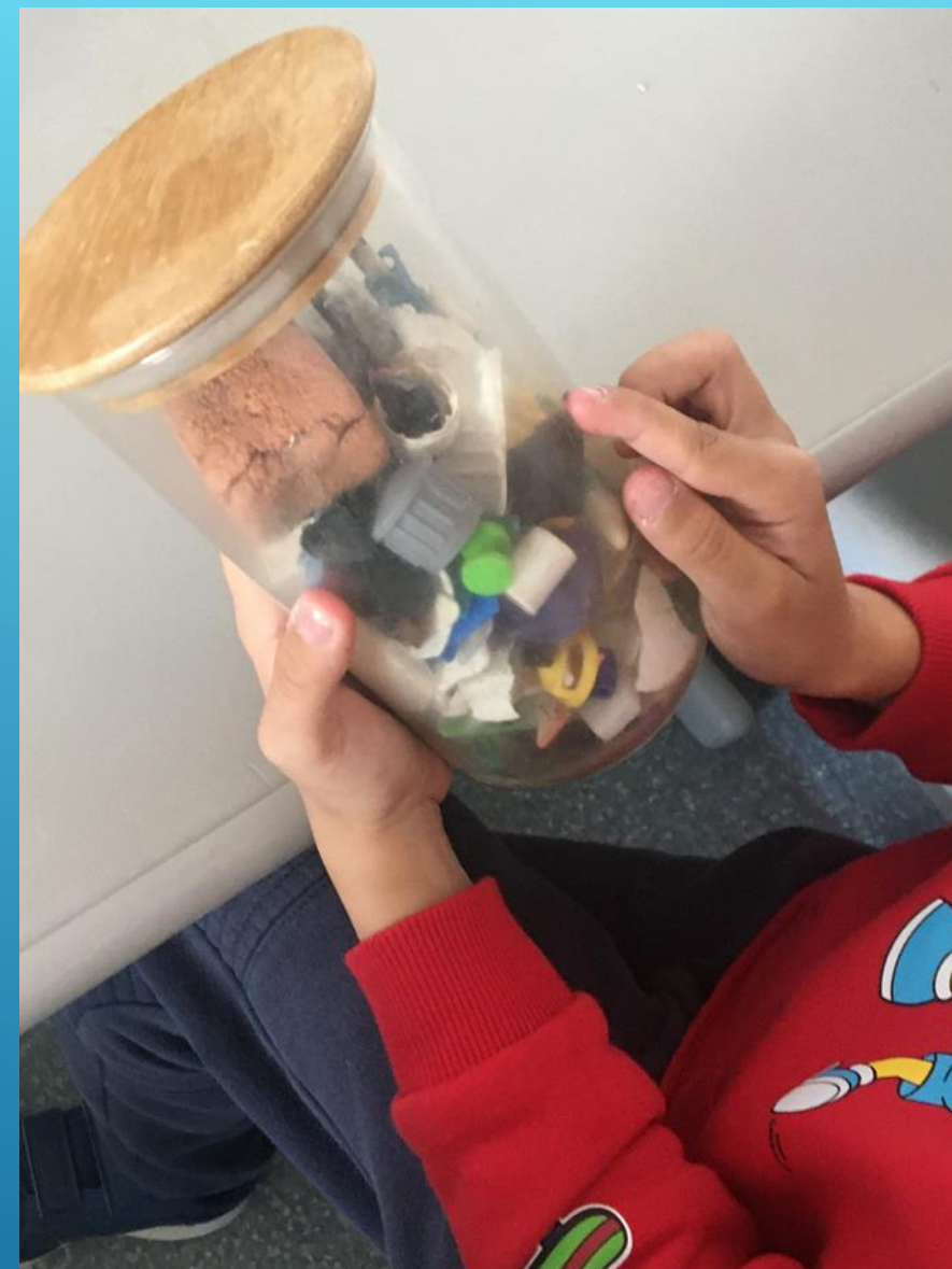
Sessão teórica e teórica-prática na Escola Básica da Ériceira