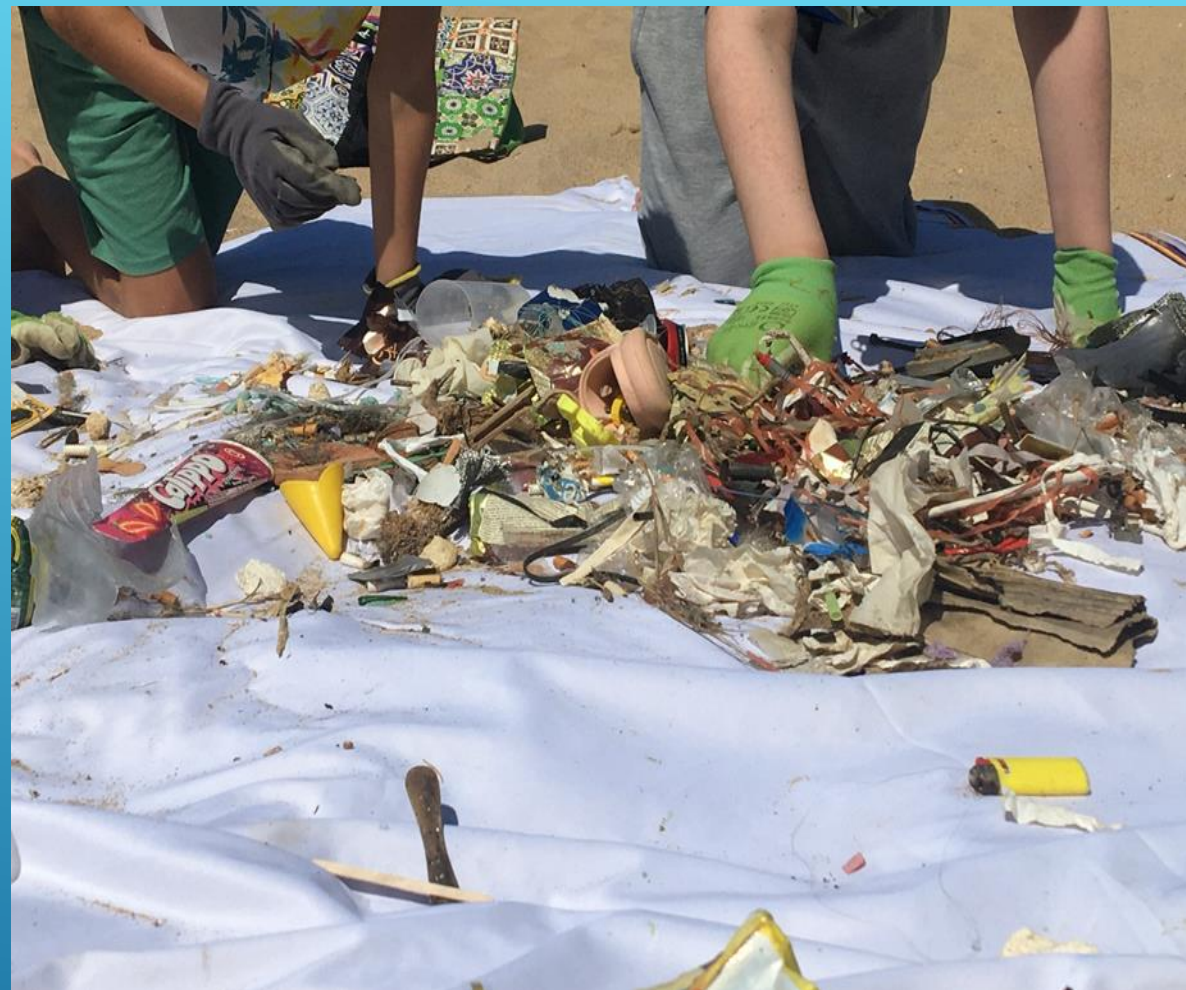
Limpeza de Praia na Foz do Lizandro com alunos da Escola Básica da Ericeira