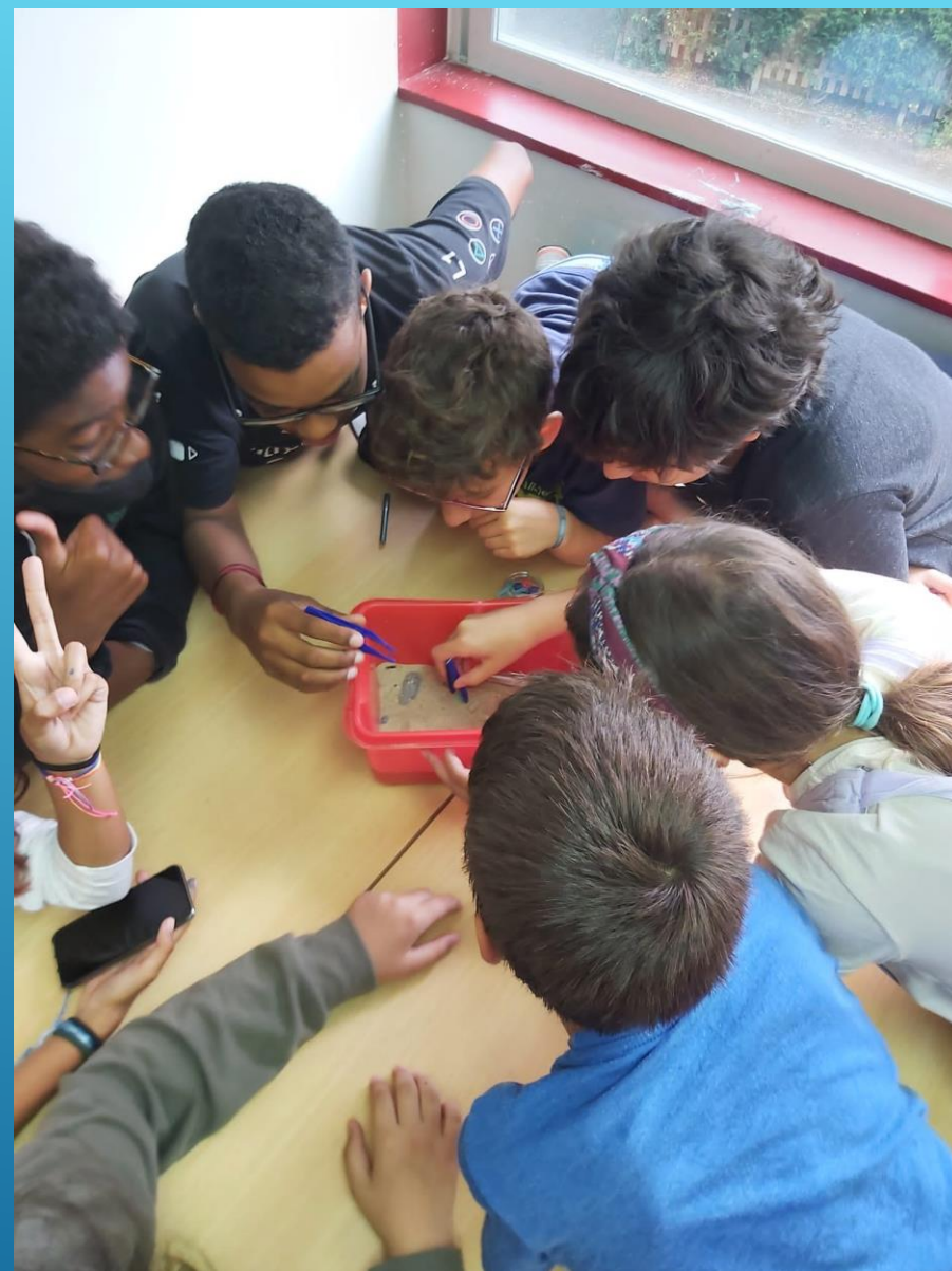
Observação de microplásticos – Escola Básica da Parede