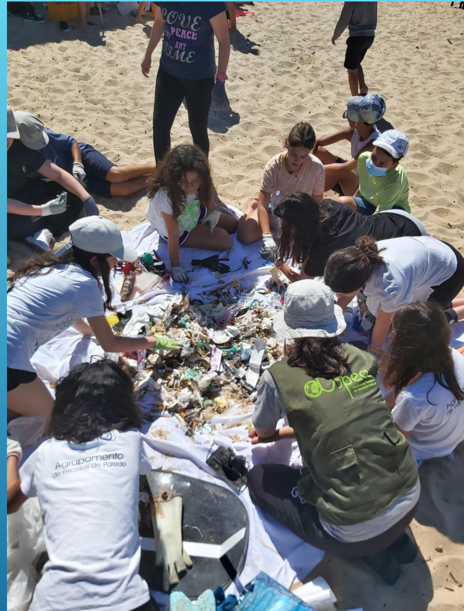
Limpeza de Praia na Praia de Cacilhas com alunos da Escola da Parede