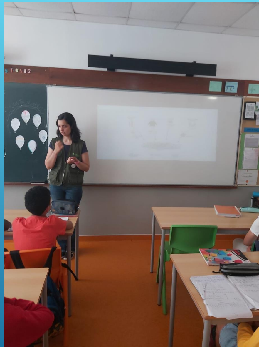
Sessões teóricas na Escola EB1 da Parede